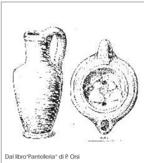
Dal libro "Pantelleria" di P. Orsi

La politica commerciale espansionistica dei Fenicio-Punici, che si basava sul dominio del mare, presto si scontrò con quella di un'altra grande potenza del Mediterraneo: Roma. Quest'ultima dal conflitto uscì vincitrice su Cartagine, rasa al suolo nella primavera del 456 a.C.. I Romani, però, a differenza dei Fenicio-Punici, non colonizzarono Pantelleria, che già contava una numerosa popolazione di residenti, ma si limitarono ad occuparla militarmente nel 217 a.C., mantenendo inalterata la preesistente organizzazione sociale e religiosa. Con i Romani, Cossyra perse la sua sovranità, per diventare una colonia del Grande Impero. Conobbe, però, un nuovo periodo di prosperità e di crescita economico sociale, con il miglioramento di diverse opere pubbliche, come il porto, reso più sicuro per i traffici commerciali, e l'agricoltura, particolarmente curata. Infatti una prima divisione e assegnazione delle terre coltivabili ai contadini, è di questo periodo, in cui sorsero anche i principali centri agricoli. Particolarmente sviluppata fu la coltura della vite, da cui si ricavava oltre all'uva essiccata, il vino "passum", il moscato passito. Con la caduta dell'Impero Romano, l'isola, fu presto terra di facile conquista da parte dei vari popoli che la incrociarono nelle loro rotte. Probabilmente i Vandali, nel 439 d.C., invasero l'isola e contemporaneamente l'Africa settentrionale.